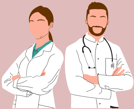
Medico Neuropsichiatra Infantile